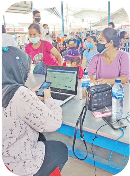
村民轮流接种疫苗