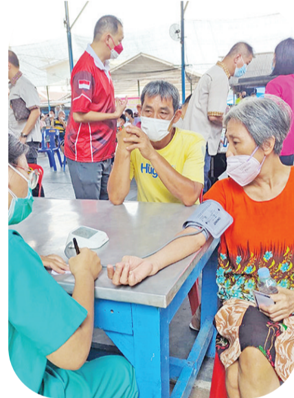
医务人员为村民测量血压