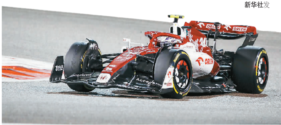
周冠宇驾驶赛车在比赛中。