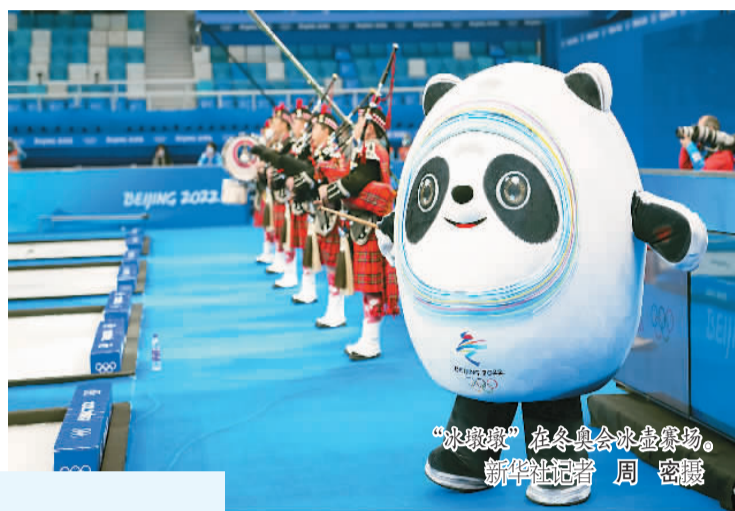
“冰墩墩”在冬奥会冰壶赛场。