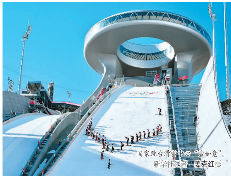
国家跳台滑雪中心“雪如意”。