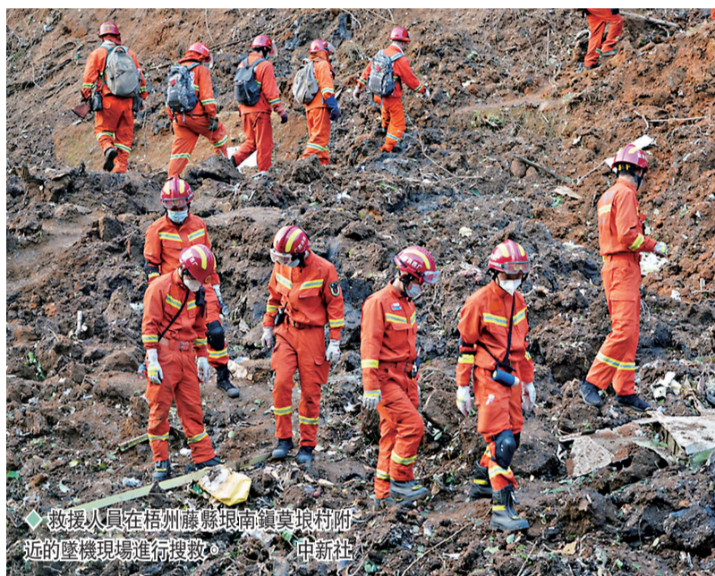
救援人員在梧州藤縣南鎮莫娘村附近的墜機現場進行搜救。

香港文匯報訊（記者 蘇征兵、曾萍 廣西梧州、南寧報道）中國東方航空一架波音737-800NG客機，21日午在執行昆明至廣州航班任務時，於廣西梧州藤縣南鎮莫娘村失事。機上人員共132人，其中旅客123人、機組9人。據人民日報客戶端消息，率先到達的消防救援人員，在山林中找到了飛機殘骸碎片，但尚未發現遇難者遺體。香港文匯報記者自南寧驅車趕赴藤縣，一路不斷見到救援車輛急馳而過。據接近現場不具姓名的人員透露，截至當晚十時，現場沒有具生命跡象的傷員抬出。官方發布的信息顯示，當晚有超千名搜救人員趕赴現場。