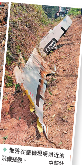
散落在墜機現場附近的飛機殘骸。

失事的東方航空MU5735航班，21日下午執飛昆明至廣州任務。按照計劃，航班於下午13點10分從昆明長水機場起飛，15點05分到達廣州白雲機場。但在下午2點21分，MU5735航班丟失ADS-B雷達信號同地面失聯。後續消息顯示，飛機失事，地點距梧州西江機場約5公里。