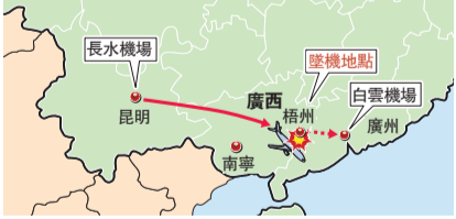
東方航空失事客機線路位置示意圖

中國央視新聞報道稱，東航目前已將公司所有737-800飛機控制在地面，尚在執飛航班的飛機則在落地後不再執行其他航班。一同將官方微博頭像變為黑白色的還有波音公司，波音公司方面對記者表示，「我們已經看到了相關報道，正在收集更多信息。」