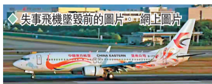
失事客機墜毀前的圖片。網上圖片

「國是直通車」公號報道，737-800機型係中國民航主流機型，共計有1,189架。其中東航有109架，南航最多達163架。報道引述民航專家說法，稱因該機型保有量太大，如果沒有證明事故係機型問題，應不至於全部停飛。而截至21日晚間，民航局暫未通知停飛所有737-800客機。