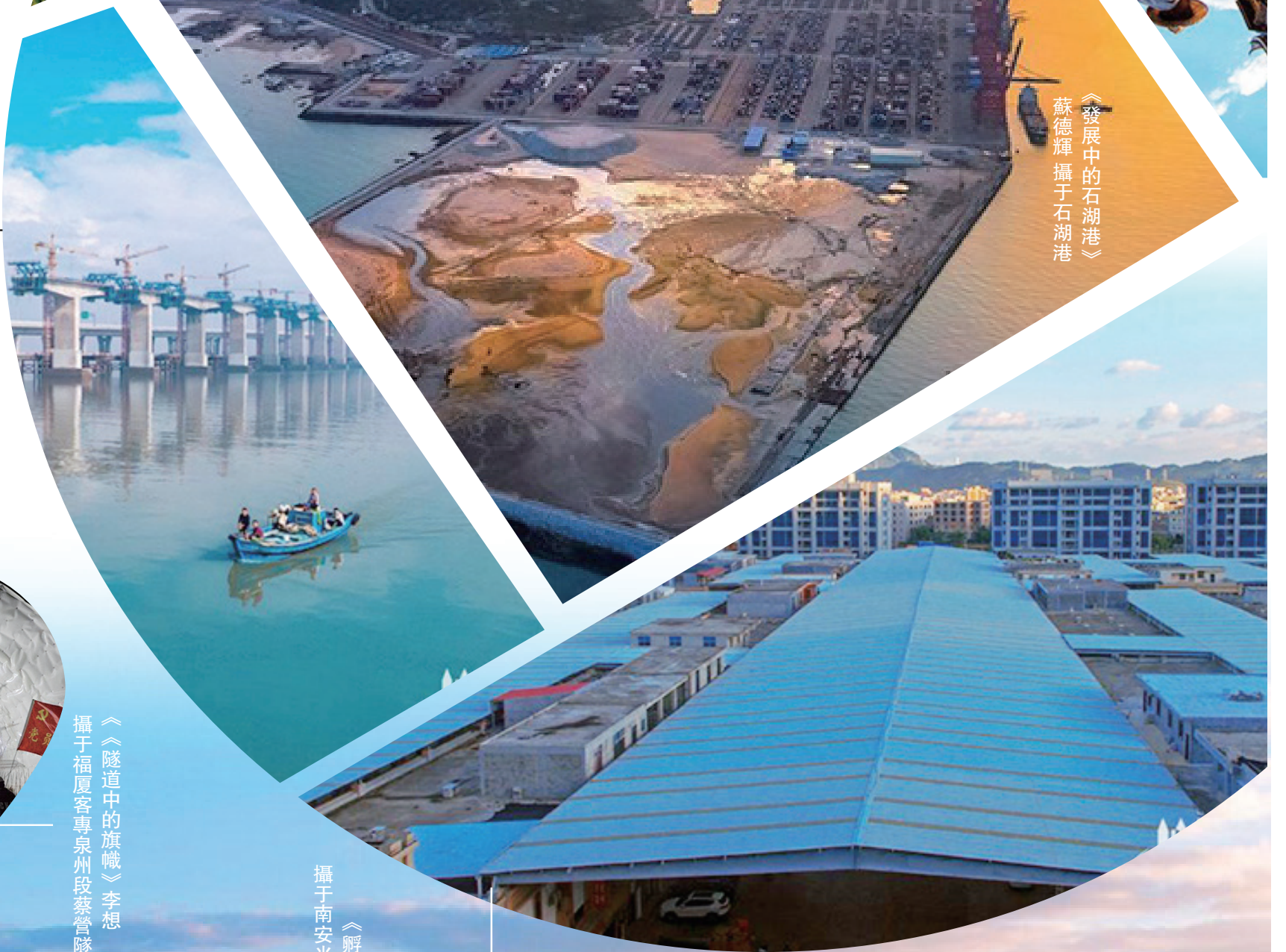
《發展中的石湖港》 蘇德輝 攝于石湖港