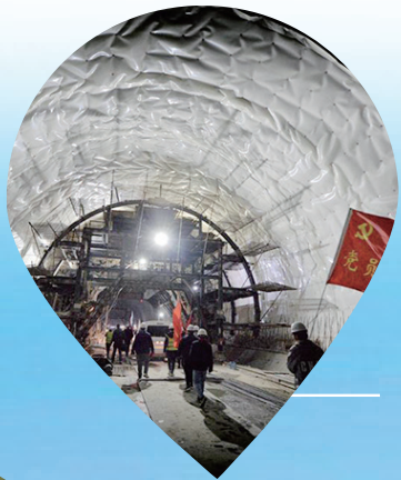
《隧道中的旗幟》于福廈客專泉州段蔡營隧道