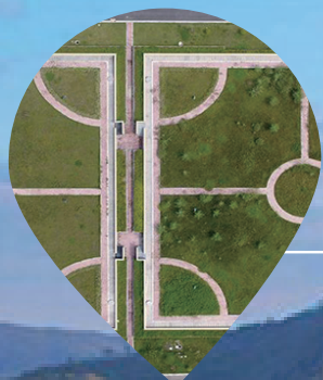
《生命之源》鄭章賢 攝于泉州水務集團金鷄水廠