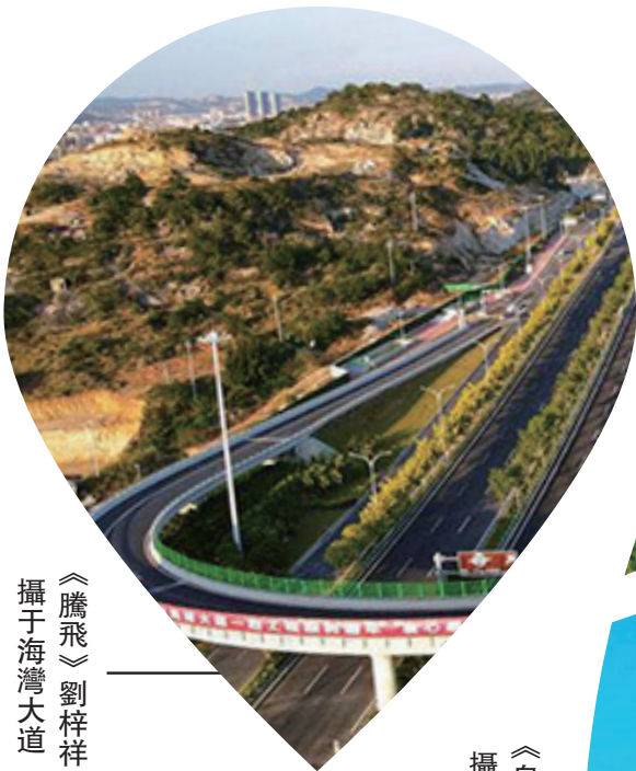
《騰飛》劉梓祥 攝于海灣大道