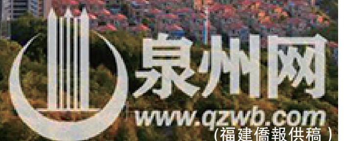
《孕育》于南安觀音山現代商貿中心項目