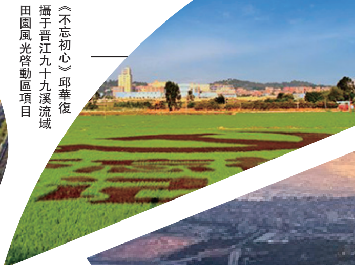
《不忘初心》邱華復 攝于晉江九十九溪流域 田園風光啓動區項目