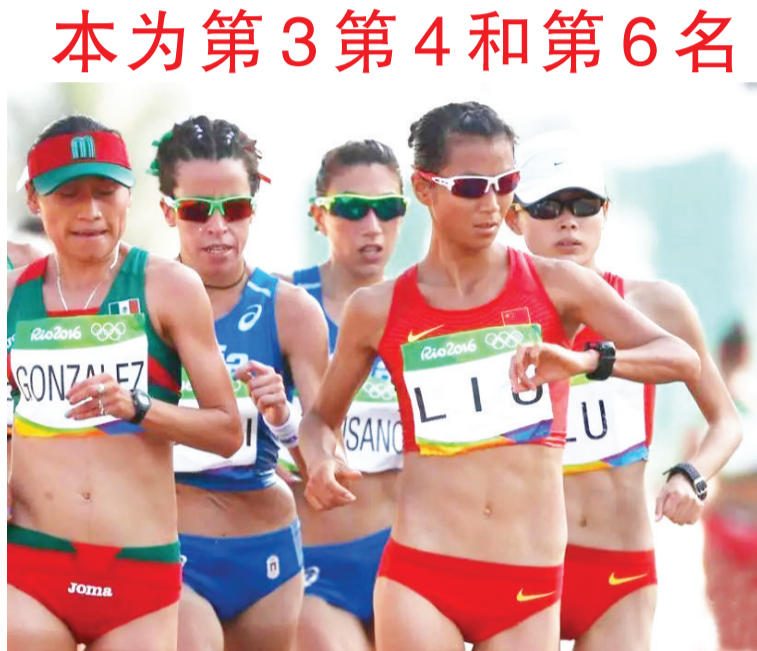
资料图:刘虹在比赛中。

当地时间21日,世界田联旗下独立调查机构“田径诚信委员会”发布公告称,2012年伦敦奥运会女子20公里竞走冠军、俄罗斯选手叶莲娜·拉什马诺娃因兴奋剂问题被取消成绩,拉什马诺娃本人已接受该决定。