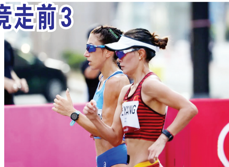
资料图:当地时间2021年8月6日,日本札幌,2020东京奥运会田径女子20公里竞走决赛。

切阳什姐莲娜·拉什马诺娃也因兴奋剂问题而被取消成绩后,三位中国选手就此包揽了该项目金银铜牌。