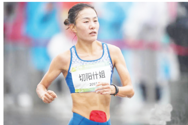
2021年9月24日,陕西西安,第十四届全运会田径女子20公里竞走赛况。