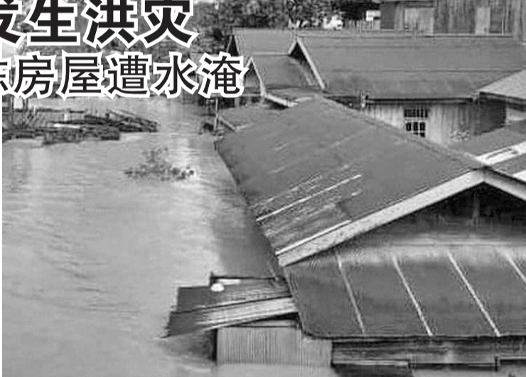
东加省东库台县洪灾严重

塔镇区 (Sangata Selatan) 在东库台县礼宾道上,目前还可以看到洪水泛滥的场景。水的排放量虽然从40厘米减少到30厘米,但水位仍然达到成年人胸部;但礼宾道的水位则低于成年人膝盖。