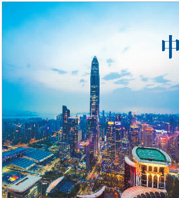
图为广东省深圳市CBD风光。