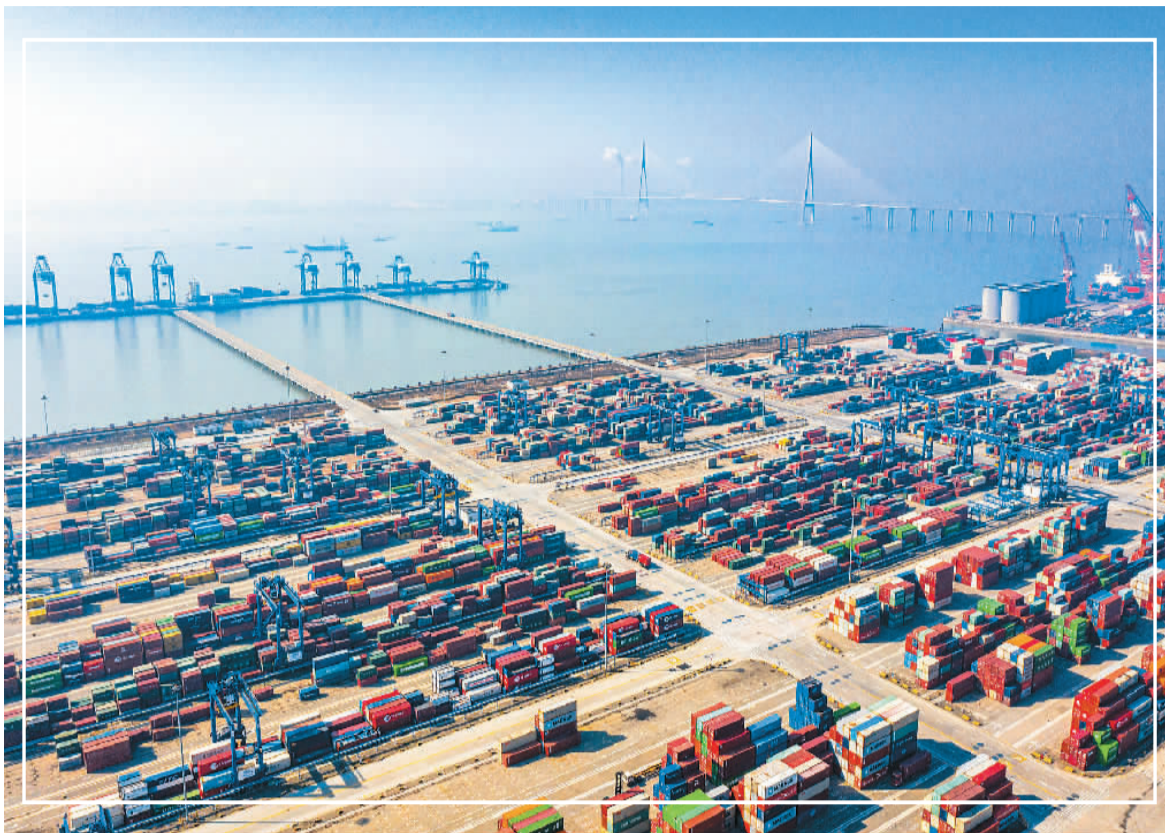
图为2022年2月26日，江苏省南通港通海港区集装箱堆场一片忙碌景象。