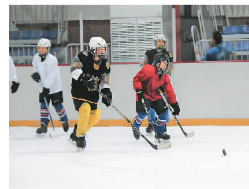
图为1月19日，在黑龙江省哈尔滨市平房区冰球馆，友协第一小学校冰球队的小队员们正在训练。