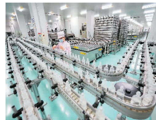
图为1月14日，河北省石家庄市一家制药有限公司的工人在医药生产车间工作。