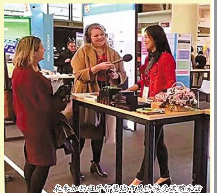
在參加西班牙智慧城市展時接受媒體採訪

領域。工廠現在已成功推出涵蓋眾多應用領域和場景的多個產品綫，相關品牌產品也贏得了海外客戶好評並已成為海外光通信領域知名商標。