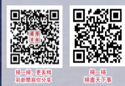
掃二維碼 更多新聞 以前新聞 05分

美國緬因大學研究人員說，基於美國國家海洋和大氣管理局建立的天氣模型，與1979年