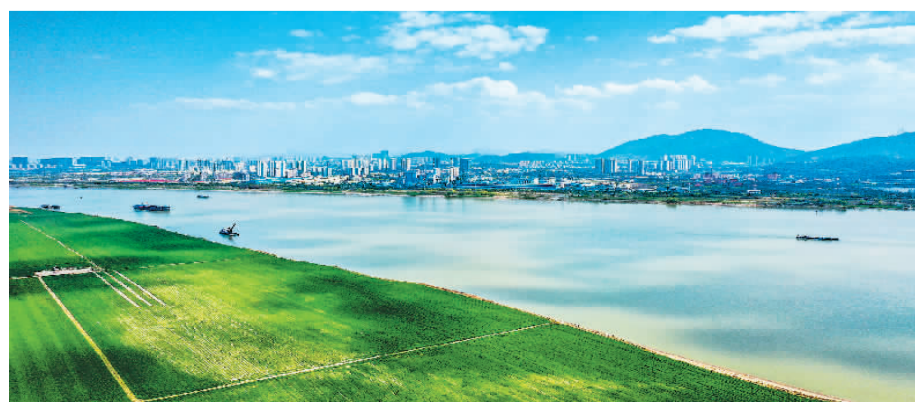
近日, 安徽省铜陵市老洲乡, 长江波光粼粼, 岸边绿地如茵, 美不胜收。近年来, 铜陵市加强长江生态环境保护, 推进生态复绿和岸线修复, 绿色发展成效显著。

前2个月, 全国政府性基金预算收入9159亿元, 同比下降27.2%; 全国政府性基金预算支出14042亿元, 同比增长27.9%。