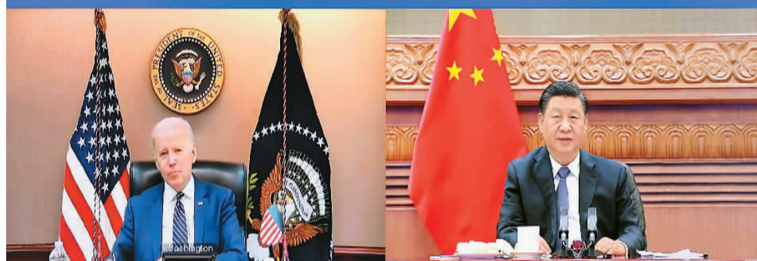
3月18日晚, 国家主席习近平在北京应约同美国总统拜登视频通话。新华社记者 刘彬摄

新华社北京3月18日电 国家主席习近平18日晚应约同美国总统拜登视频通话。两国元首就中美关系和乌克兰局势等共同关心的问题坦诚深入交换了意见。 拜登表示, 50年前, 美中两国作出重要抉择, 发表了“上海公报”。50年后的今天, 中美关系再次处于关键时刻, 中美关系如何发展将塑造21世纪的世界格局。我愿重申: 美国不寻求同中国打“新冷战”, 不寻求改变中国体制, 不寻求通过强化同盟关系反对中国, 不支持“台独”, 无意同中国发生冲突。美方愿同中方坦诚对话, 加强合作, 坚持一个中国政策, 有效管控好竞争和分歧, 推动中美关系稳定发展。我愿同习近平主席保持密切沟通, 为中美关系把舵定向。 习近平指出, 去年11月我们首次“云会晤”以来, 国际形势发生了新的重大变化。和平与发展的时代主题面临严峻挑战, 世界既不太平也不安宁。作为联合国安理会常任理事国和世界前两大经济体, 我们不仅要引领中美关系沿着正确轨道向前发展, 而且要承担应尽的国际责任, 为世界的和平与安宁作出努力。 习近平强调, 我和总统先生都赞同中美要相互尊重、和平共处、避免对抗, 都同意双方在各级各领域要加强沟通对话。总统先生刚才又重申, 美方不寻求打“新冷战”, 不寻求改变中国体制, 不寻求通过强化同盟关系反对中国, 不支持“台独”, 无意同中国发生冲突。对于你的这些表态, 我是十分重视的。 习近平指出, 目前, 中美关系还没有走出美国上一届政府制造的困境, 反而遭遇了越来越多的挑战。特别是美国一些人向“台独”势力发出错误信号, 这是十分危险的。台湾问题如果处理不好, 将会对两国关系造成颠覆性影响。希望美方予以足够重视。中美关系之所以出现目前的局面, 直接原因是, 美方一些人没有落实我们两人达成的重要共识, 也没有把总统先生的积极表态落到实处。美方对中国的战略意图作出了错误误判。 习近平强调, 中美过去和现在都有分歧, 将来还会有分歧。关键是管控好分歧。一个稳定发展的中美关系, 对双方都是有利的。 双方就当前乌克兰局势交换意见。