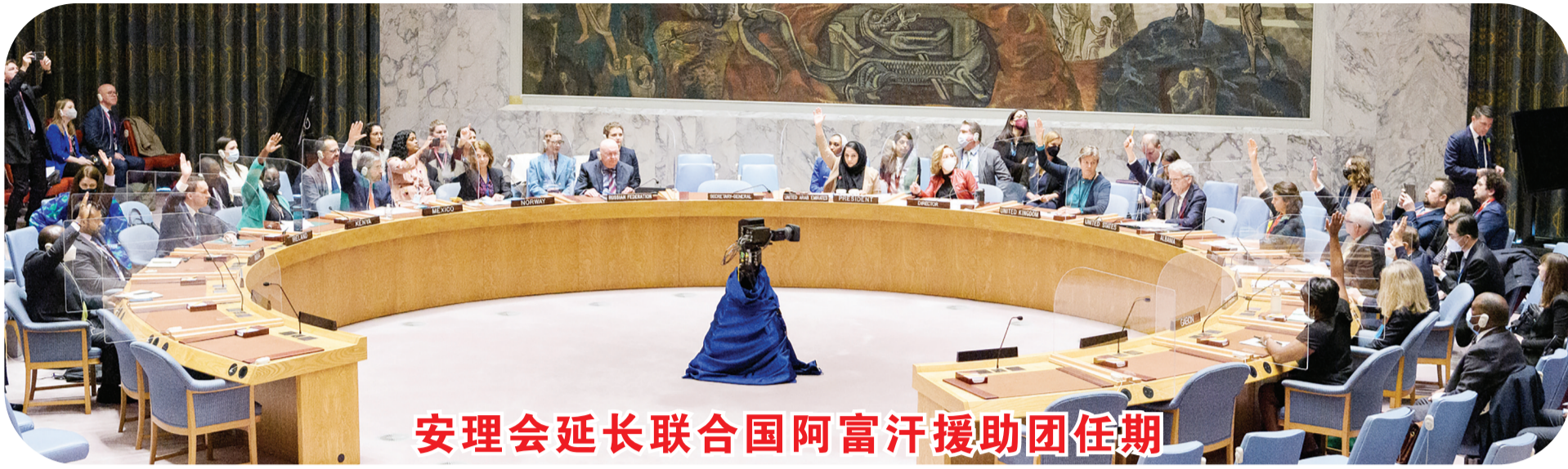
安理会延长联合国阿富汗援助团任期

3月17日,在位于纽约的联合国总部,联合国安理会对决议进行表决。联合国安理会17日通过第2626号决议,决定将联合国阿富汗援助团(联阿援助团)任期延长一年,至2023年3月17日。