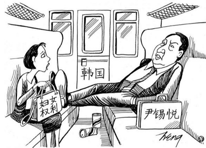
漫画 王锦松(原载《联合早报》)

耕灶文友已逝世,和她交心的日子也已逝去,但她认真的工作态度学习精神,刻骨铭心,永远难忘,永远不逝,她永远在我心中。缅怀无穷回味往日美好时光,千山万水总是情,这一切的一切已成追忆,此情无计可消除,才下眉头,却上心头。