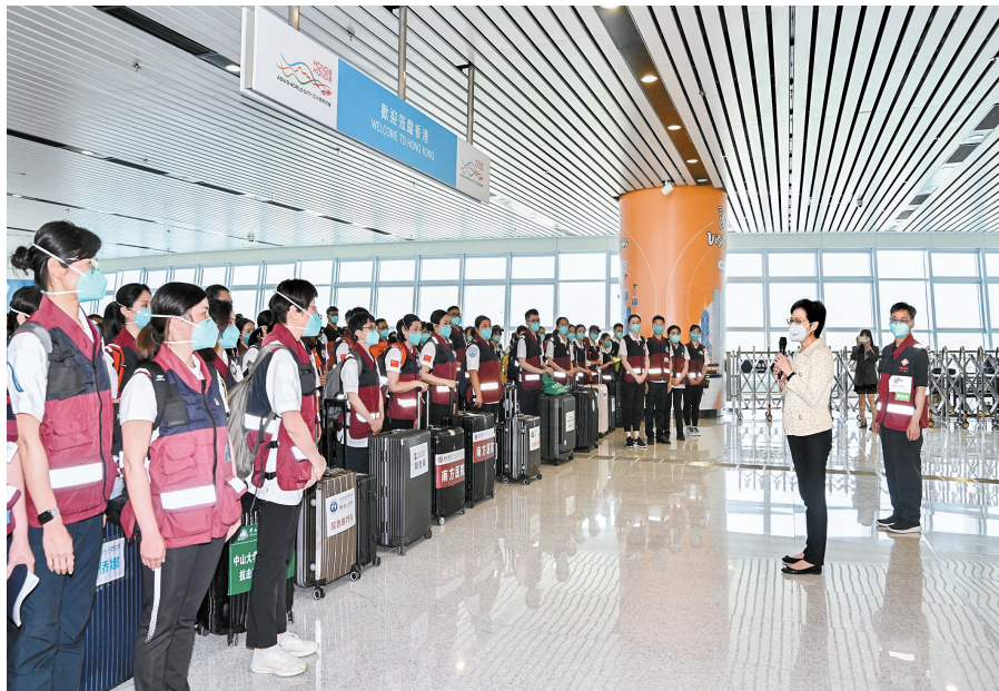
林鄭月娥（持咪者）向內地援港醫療隊致歡迎辭。