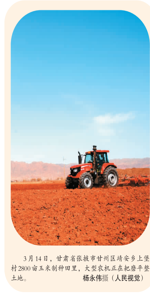
3月14日，甘肃省张掖市甘州区靖安乡上堡村2800亩玉米制种田里，大型农机正在耙磨平整土地。

“比如，如何合理确定信用卡额度、如何加强持卡人教育、如何保护消费者信息安全，都是实现金融与消费良性循环要回答的问题。”董希淼说，银行等金融机构应当把消费者权益保护理念贯穿到经营管理各个环节，加强对金融产品和服务的审核把关，保障消费者隐私和信息安全，加强分支机构和员工日常培训，改进与客户沟通的方式方法，提升服务水平和能力。