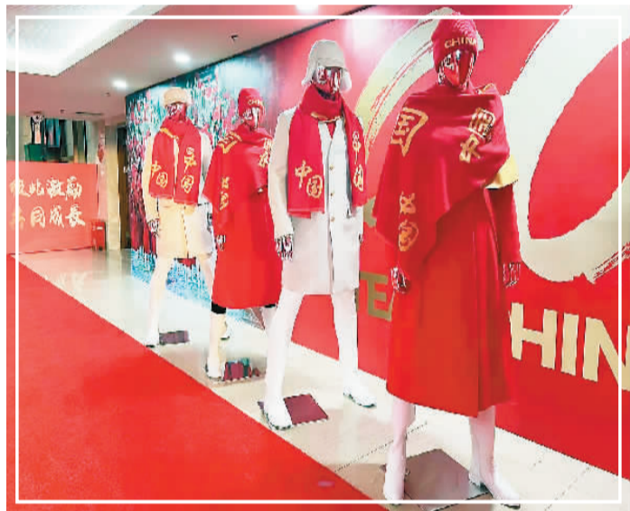
中国代表团在北京冬奥会开幕式上的入场礼服：女运动员服装采用红色大衣配白色高筒靴；男运动员服装则采用时尚米白色大衣配白色西裤、白色短靴。

装形制以简约为主，选用中式服装元素，结合西式服装剪裁方法，使服装整体兼备东方文化韵味与结构科学美。