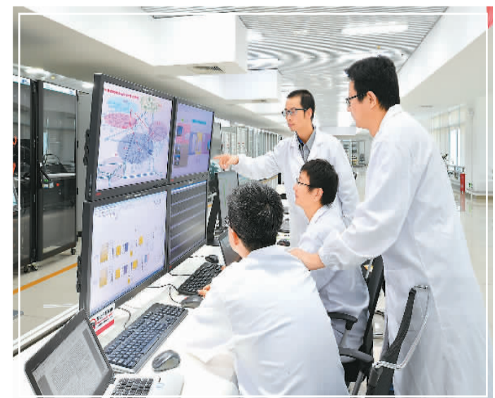
智研院海归科研人员正在开展工程仿真试验。

从2012年建院以来，智研院始终聚焦两大任务——创新与人才培养。截至目前，智研院有留学经历的在职人员近60人，占员工总数近10%。在2021年新招聘的34人中，海归人才有12名；引进高水紧缺人才10名，其中海归人才3名。对于海归人才来说，个人梦与家国梦，正在这里完美融合。(刘晓雷 孙雯 贾文颖 季昕)