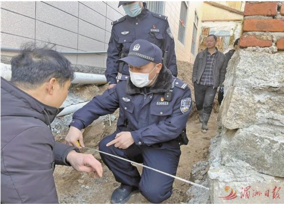
圖為民警進村現場協調解決村民宅基地糾紛問題。 (莆田網訊)開春以來，市、縣(區)兩級公安機關民警走進社區村居，大力開展“我