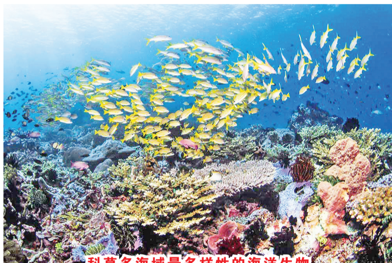
科莫多海域最多多样性的海洋生物