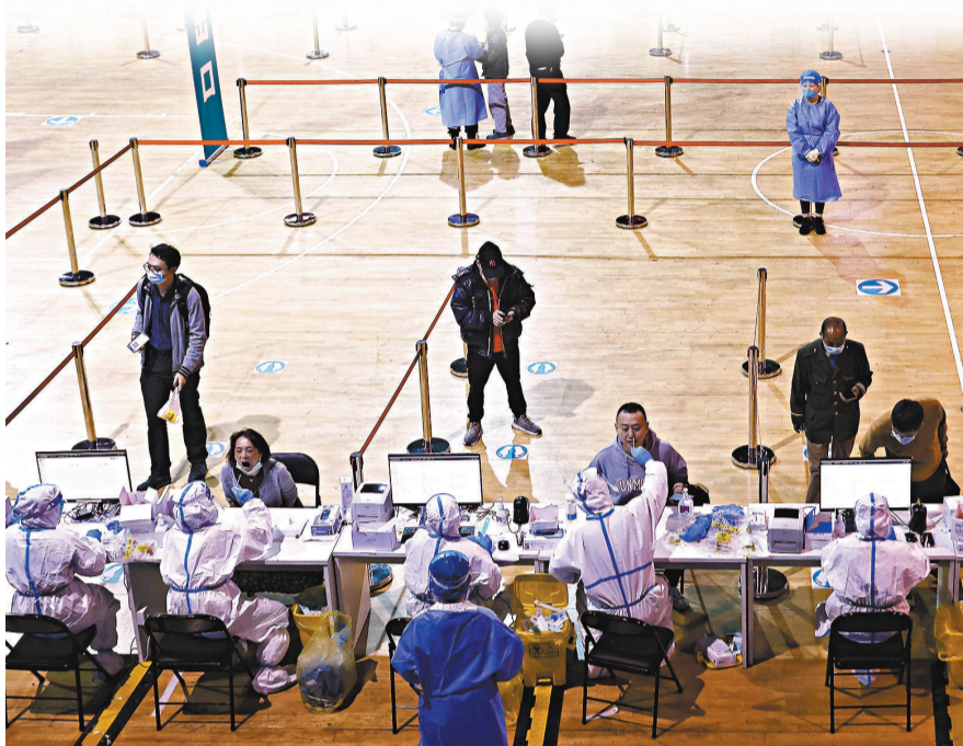
張文宏說,以上海為例,這波疫情發生突然,啟動晚,病毒快。圖為3月14日,上海市黃浦區盧灣體育場臨時核酸檢測點啓用。