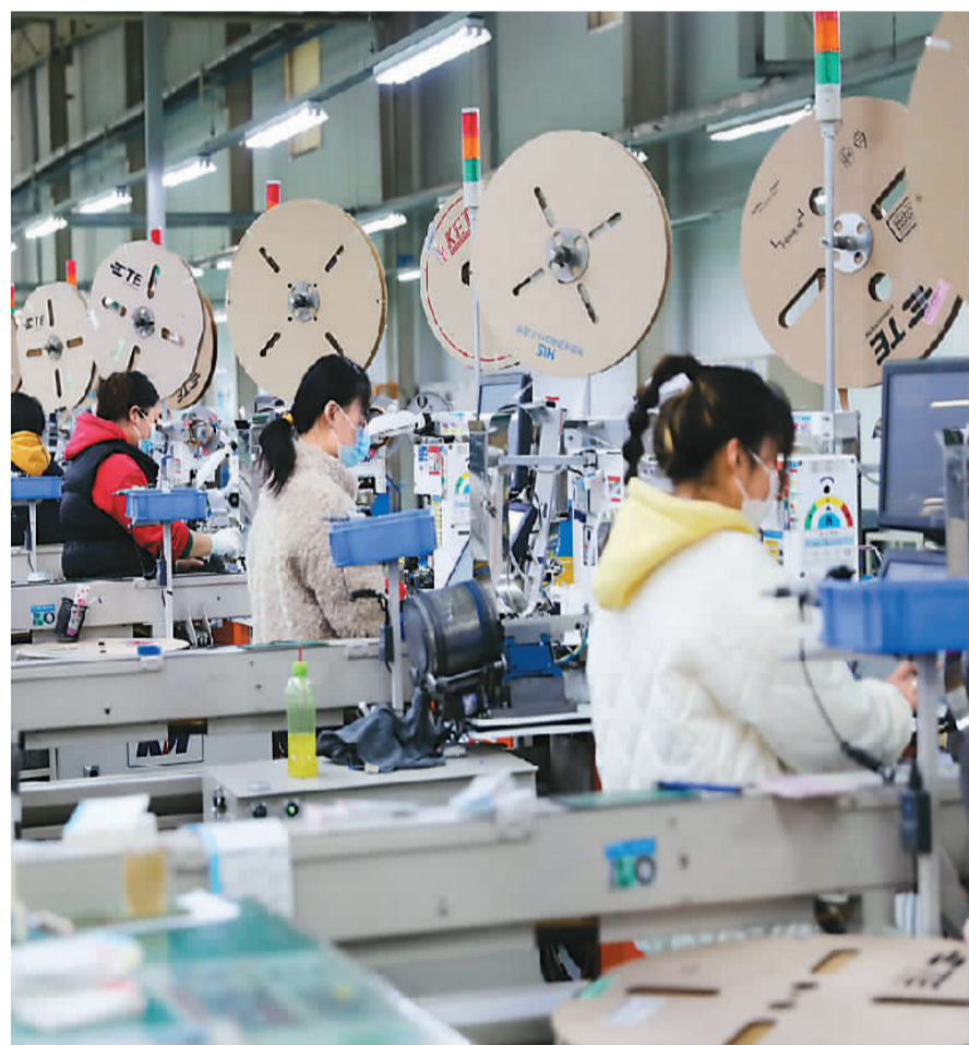
▲安徽淮北市高新技术产业开发区一家外资企业内,工人在车间生产汽车电子线束产品。

面对机遇,中西部地区自身也积极准备。“近年来,我们积极争当国内国际双循环物流链接的关键节点,不断加强外投资项目招商力度,加快区位优势向产业发展优势转化。特别是积极拓展航空物流价值链,促