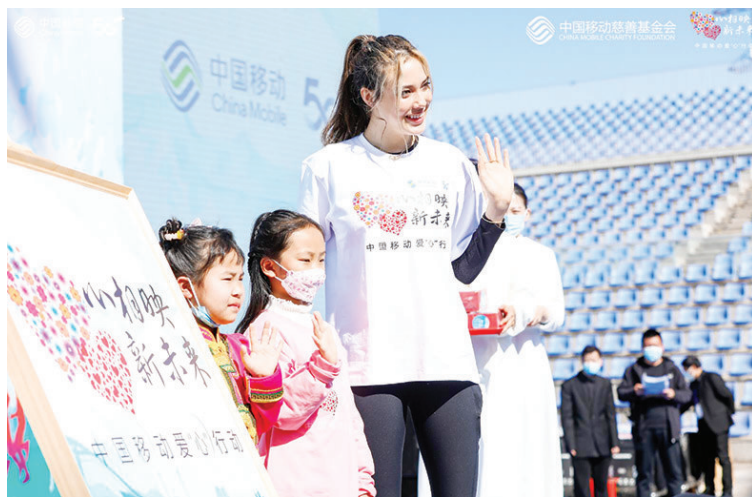
谷爱凌在现场与小朋友互动。

中新网客户端北京3月15日电14日,谷爱凌重返在北京冬奥会上的夺金地——首钢滑雪大跳台,参加由中国移动主办的“移起有为,智向未来”爱心慈善跑活动。谈及北京冬奥会后会尝试哪些滑雪之外的运动时,谷爱凌坦言想尝试冲浪,还想踢场足球。