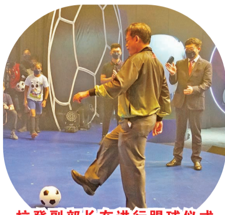
拉登副部长在进行踢球仪式