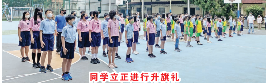
同学立正进行升旗礼