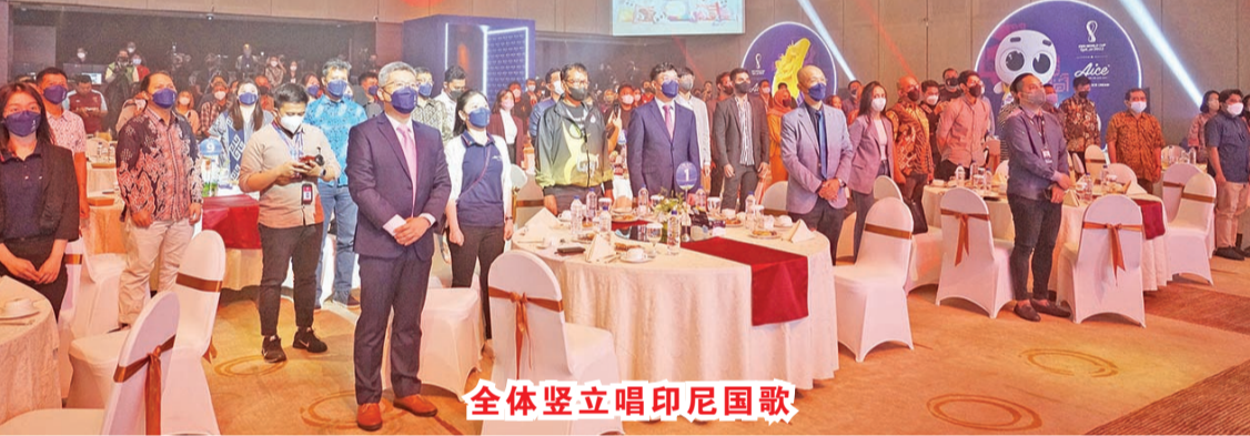
全体竖立唱印尼国歌