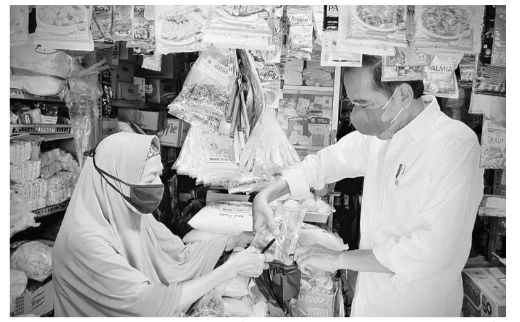
佐科维总统亲自视察调查日惹传统市场上的食用油供应和价格。

Sentul市场，调查的小商贩的食用油供应情况。在这两个市场，总统发现食用油的售价各不相同，从每公升1万4000盾至每公升2万盾不等。 虽然食用油的价格高企，但也不能保证市场的货物供应。 佐科维总统在评论高价食用油时表示，市场上是有货，但价格昂贵。小摊商直言，就算有货也是很久才供应一次，一旦卖完了，还不知何时可再到货。 另一个问题是，在小摊商和便利店询问食用油抵达的明确时间表时，总统没有获得关于何时食用油抵达的确切答案。几乎所有的小摊商都不知道什么时候会有下一批货物抵达。 内阁秘书长普拉莫诺(Pramono Anung)在麻里巴板市发布的新闻声明中表示，佐科维总统在日惹市进行的视察是一种习惯，包括针对食用油。