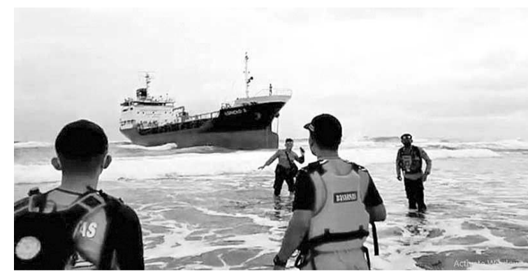
Edricko 3号油轮在西爪哇牙律县区的善章(Sancang)水域搁浅。

力进行疏散行动，但还是没有成功。至今，仍无任何发展，计划在3月20日(星期日)，再行实施疏散计划。 巴尔雅指出，目前，载有15名船员的Edricko 3号油轮被困在Sancang海滩地区的情况仍然稳定。全体船员选择按照公司的指示留在船上，除非发生船只倾斜或危险，否则不应离开船。警方仍处于待命状态，以监控搁浅的油轮，包括确保所有在船上的船员都安全。据说，船上未来