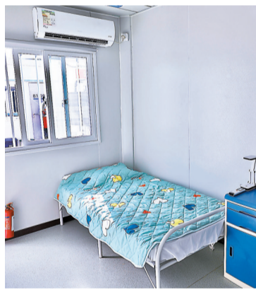
◆「方艙」內設有空調。

香港文匯報訊(記者 張弦)港珠澳大橋香港口岸人工島社區隔離設施雖然施工期僅14日，但整個項目布局井井有條，並配套齊全，整個設施共有400多個隔離房間，可安排約1,200個隔離床位。港珠澳大橋香港口岸人工島社區隔離設施佔地面積約2.4萬平方米，建築面積約8,000平方米，總計400多個組合屋由一個個模塊箱式房屋組合而成，每一個房間都配備基本傢俬及床上用品、檯燈、冷氣機、煙霧探測器、滅火筒等設施。據現場可見，有的房間內放置有三張床、三張檯、及三張床頭櫃，可供入住市民存放個人物品，而櫃上亦放置了多瓶礦泉水、熱水壺、多卷紙巾、檯燈等生活所需物資，床上亦配置有乾淨的床墊等床上用品，整體房間乾淨整潔。