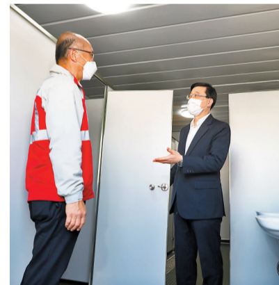
◆李家超視察隔離設施的洗手間。