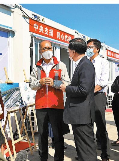
◆李家超了解設施布局。