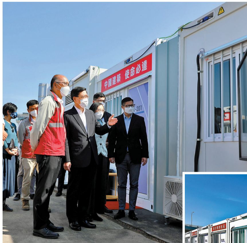
▲李家超巡視港珠澳大橋香港口岸人工島社區隔離設施。

香港文匯報訊(記者 張弦)由中央援建的港珠澳大橋香港口岸人工島社區隔離設施12日舉行交付儀式，再次以兩周的驚人速度建成，是第三個竣工的中央援建社區隔離設施。香港特區政府政務司司長李家超12日上午到場視察接收，並指隔離設施的建成代表着中央全力支持香港特區的抗疫工作。他感謝中央、香港中聯辦和中建集團令隔離設施迅速落成，亦對24小時施工的工程人員全情投入、不眠不休的精神，表示充分肯定和感謝。李家超指人工島設施交付後會即日投入服務，特區政府將用好設施，盡早隔離感染者，盡快穩控疫情。