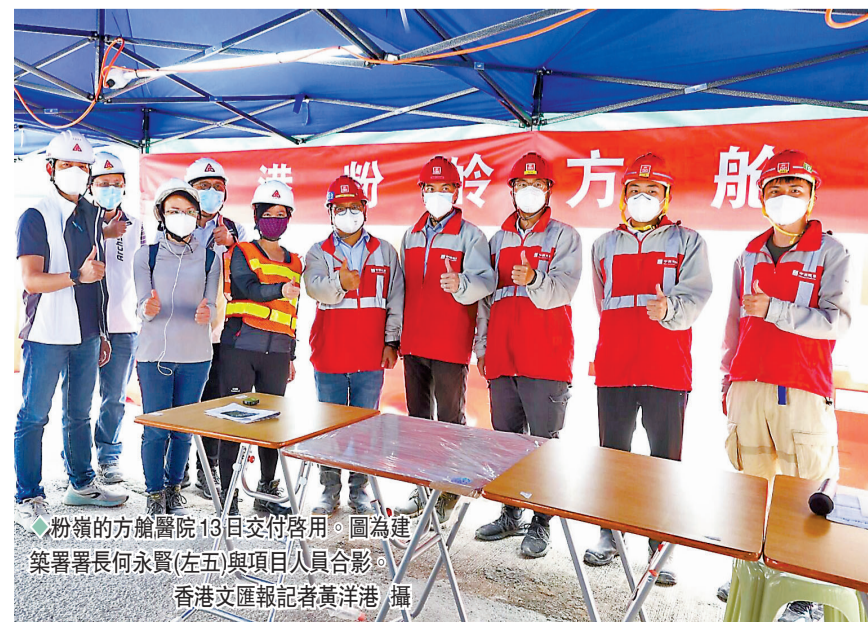
粉嶺的方艙醫院13日交付啟用。圖為建築署署長何永賢(左五)與項目人員合影。

何永賢表示，施工隊克服重重困難，完成了「不可能的任務」，以「奧運精神」自我勉勵，僅用一週時間便交付了青衣方艙，而相關經驗更是被運用在粉嶺與其他幾處的相關工作中。「一想到急症室還有許多病人在苦等，我們便意識到自己在挽救生命，工期要按小時去排，盡快提供更多床位給病人入住。」她解釋，時間緊迫是最大的困難，例如青衣方艙醫院工期緊張，施工隊未有足夠時間將本地地盤用「刮平」，故而雨後低窪處出現積水，為市民帶來不便感到抱歉。