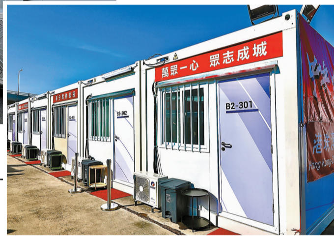
▲港珠澳大橋香港口岸人工島社區隔離設施提供約1,200床位。