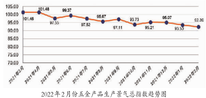
2022年2月份五金产品生产景气指数趋势图

2月份,五金产品生产景气指数收于92.30点,环比下跌1.20点,生产状况略差于上月。从十二大类行业来看,生产景气指数呈现两升九降一平格局。结构性指标呈现不同程度波动,其中,要素供给景气指数环比上升0.66点,市场需求景气指数环比上升0.09点,运营效益景气指数环比上升0.18点,总体判断景气指数环比下降4.64点。