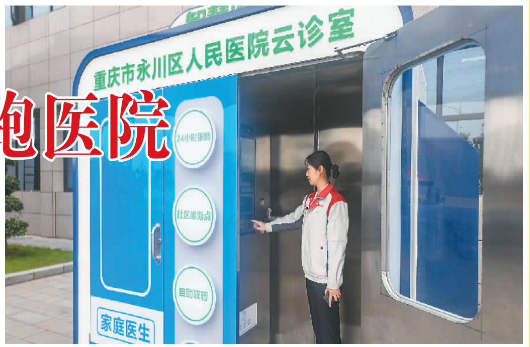
工作人员在位于重庆市永川区的“智慧健康小屋”内体验智慧医疗服务。

中国互联网网络信息中心近日发布的第49次《中国互联网络发展状况统计报告》显示,截至2021年12月,在线医疗用户规模达2.98亿,同比增长38.7%,成为用户规模增长最快的应用之一。防疫期间的就诊需求催生互联网医疗迅猛发展,在线服务让患者看病越来越便利。