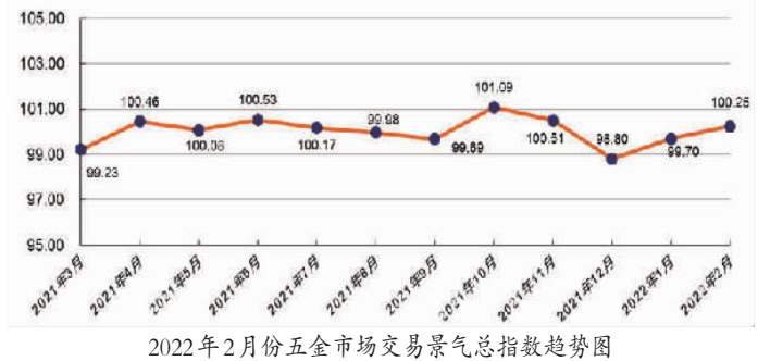
2022年2月份五金市场交易景气指数趋势图

2月份,永康五金市场交易景气指数为100.25点,环比上升0.56点。十二大类行业景气指数呈现十升二降格局。结构性指标呈现不同程度波动,其中,要素供给景气指数环比下跌6.18点,市场需求景气指数环比上升2.85点,运营效益景气指数环比上升1.94点,总体判断景气指数环比上升1.83点。