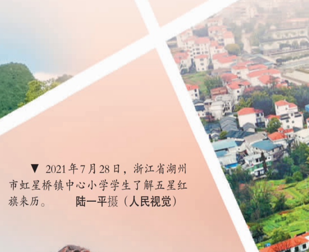
2021年7月28日，浙江省湖州市虹星桥镇中心小学学生了解五星红旗来历。