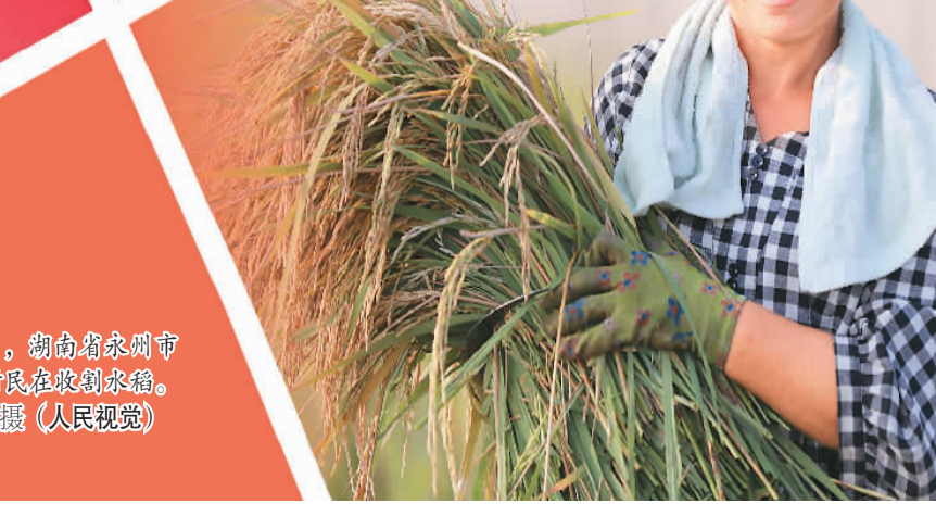
2021年9月5日，湖南省永州市道县清塘镇陈庄村，村民在收割水稻。