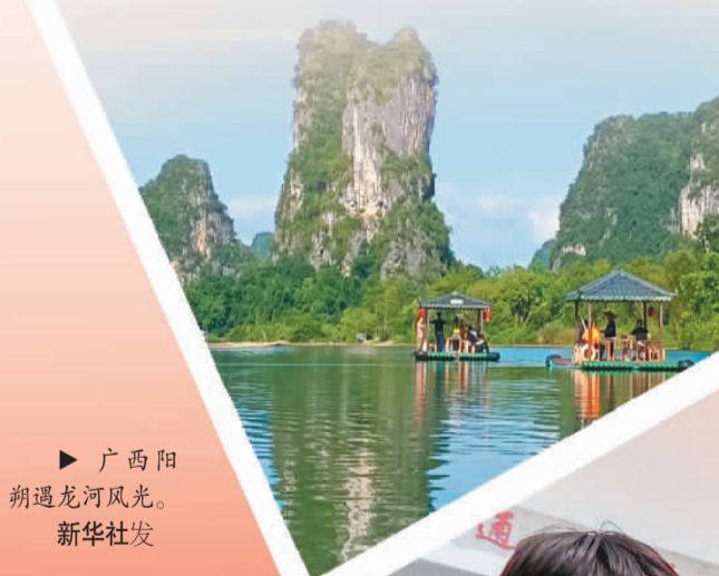
广西阳朔遇龙河风光。