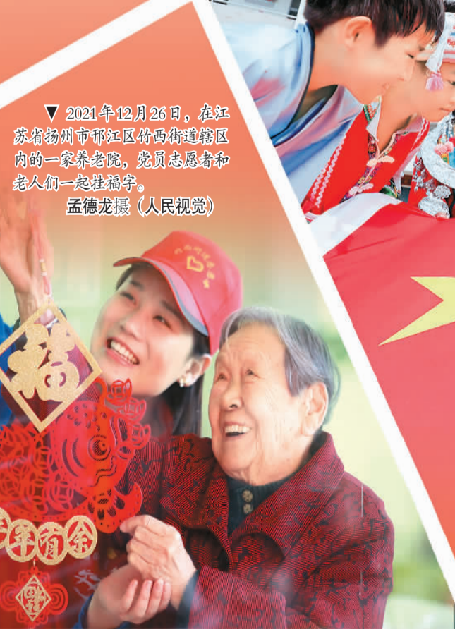
2021年12月26日，在江苏省扬州市邗江区竹西街道辖区内的一家养老院，党员志愿者和老人们一起挂福字。