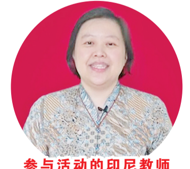
参与活动的印尼教师