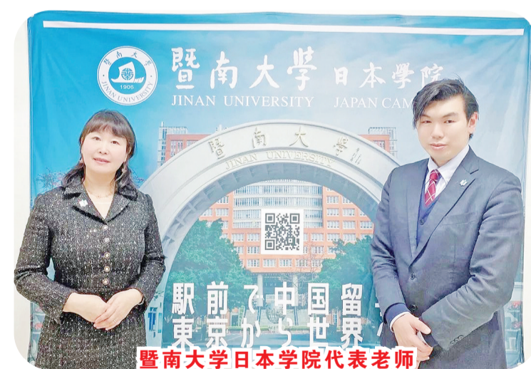
暨南大学日本学院代表老师

广府美食等岭南文化剪影,也包含了中国画,彩绘中国,中国剪纸等体验课程。学员们在课堂上聚精会神,在老师的引导下不断思考,积极互动,分享自己的观点和经验,还在课下认真完成课后作业,看到视频之时,不少学员在