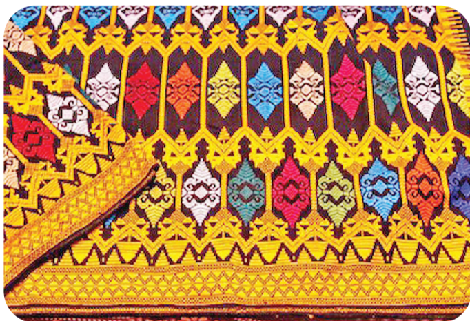
龙目岛传统编织图案苏巴南