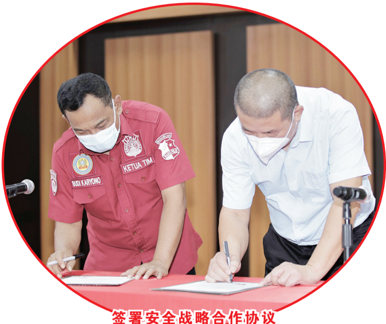
签署安全战略合作协议

中新社雅加达3月11日电(记者林永传)中企印尼德龙工业园与印尼国家警察安全维护局11日在位于苏拉威西岛的该工业园签署安全战略合作协议,标志印尼国家警察机构将为该“一带一路”建设重点项目保驾护航。