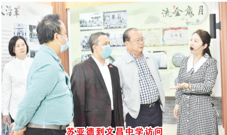
苏亚德到文昌中学访问

央广网海口3月11日消息(记者钟宁 通讯员王雷)“一下飞机,看到婆娑的椰子树和灿烂的三角梅,让我感觉回到了家乡。”3月9日,印度尼西亚共和国驻华大使馆教育文化参赞苏亚德在海口参加文化交流活动时表示,受疫情影响,他已经两年没有返回印尼,海南的阳光海滩和椰林鲜花,让他有