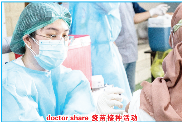
doctor share 疫苗接种活动