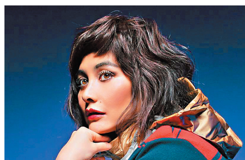
◆何超儀祝願香港平安,戰勝疫情。

香港文匯報訊(記者 李思穎)香港正經歷前所未有的疫情,確診及死亡人數持續高企,何超儀見到此情此境,不禁心酸難過,她有感而發在社交媒體發文:「要關心別人,先要懂得關心自己,少一個人染疫,才可讓更多的醫療資源留給真正有需要的人。」她更親筆寫下真摯感言。