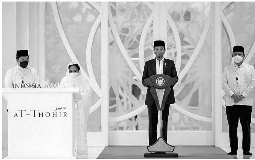
佐科维总统为 At-Thohir 清真寺主持开幕

【本报讯】3月9日(星期三),佐科维总统主持了西爪哇省德博市(Depok)达波斯地区(Tapos)的阿特-托希尔(At-Thohir)清真寺落成典礼。 佐科维总统希望 At-Thohir 清真寺的存在除了作为礼拜场所外,还可以用来增加伊斯兰的认知与洞察力。 援引总统府秘书处的消息,佐科维总统指出,作为一个现代化的讲道中心,是接受教育与启发的场所,以及建立和加强联谊的地