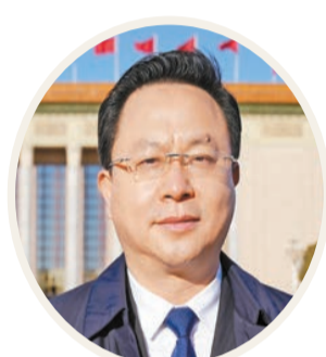
全國人大代表、湖北省鄂州市委書記 孫兵