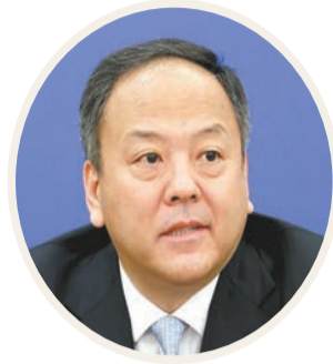
全國人大代表、哈爾濱市長 孫喆