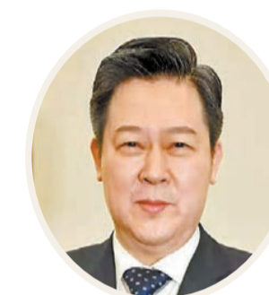
全國人大代表、湘潭市委書記 劉志仁