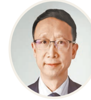
全國政協委員、重慶市文旅委主任 劉旗