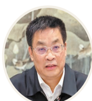
全國人大代表、廣西壯族自治區民族委主任 班忠柏