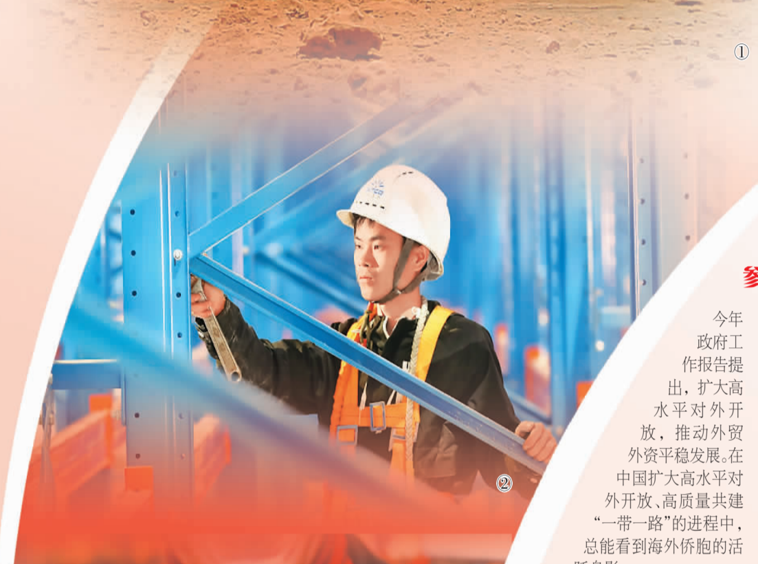
图②：2021年10月31日，在浙江省湖州市德清县乾元镇的科字5G智慧冷链仓储基地，技术人员正在调试超低温自动化立体仓库。