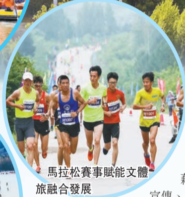
馬拉松賽事賦能文體 旅融合發展