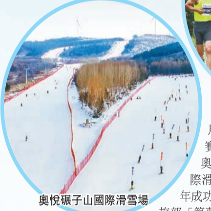
奧悅碾子山國際滑雪場

馬拉松金牌賽事「榮譽」：奧悅碾子山國際滑雪場，2021年成功入選國家文體旅部「築夢冰雪·相伴冬奧」全國冰雪旅遊精品線路。雅魯河漂流河水清澈見底，兩岸青山疊翠，有「黑龍江省西部第一漂」美譽。華安軍工文化園被授予省級國防教育基地、省級研學實踐教育活動營地、齊齊哈爾市工業旅遊示範基地和黑龍江省電視劇拍攝基地；雲祥射擊場使華安軍工文化園成為全國唯一的火炮實射和槍實彈射擊的軍事體驗基地。興安山風景區景點多樣、內涵豐富，由蛇洞山、佛爾寺、起雲台、菩提泉、鶴城第一峰等組成，滿足了遊客運動、休閒、參佛、觀光等多種需求。此外，世紀廣場、油菜花海、中東鐵路廣場、俄羅斯水塔等人文景觀也增添了新的秀色。2021年，央視《直播長城》欄目在此拍攝取景；《2022迎冬奧約北京BRTV環球跨年冰雪盛典》，奧悅碾子山國際滑雪場作為黑龍江省唯一入選拍攝地；