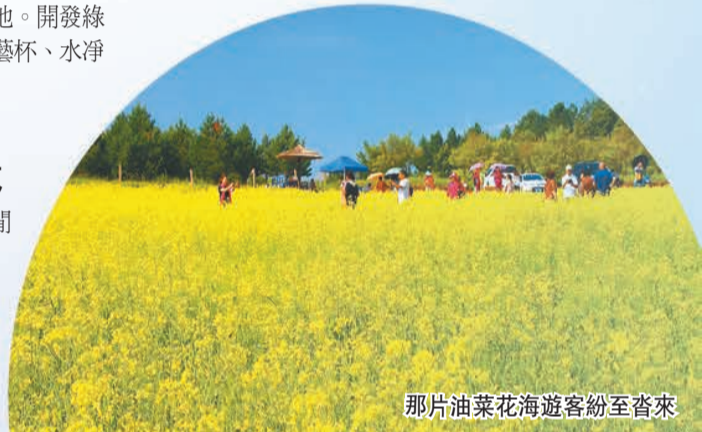
那片油菜花海遊客紛至沓來

未來，碾子山堅持「旅遊立區」發展思路不動搖，扎實推進「工業富區、生態興區」發展基礎，深入實施鄉村振興工程、民生改善工程、城建提升等一系列工程，全面加強黨的建設，牢牢把握發展機遇，以抓鐵有痕、踏石留印的幹勁，開啓一場充滿智慧與力量的新征程。