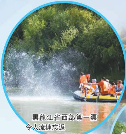
黑龍江省西部第一漂 令人流連忘返