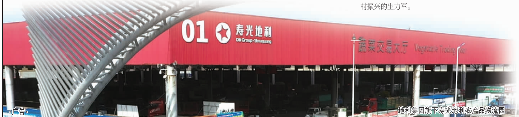
地利集团旗下寿光地利农产品物流园