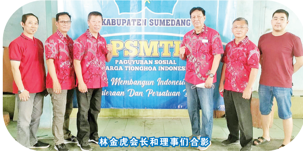
林金虎会长和理事们合影