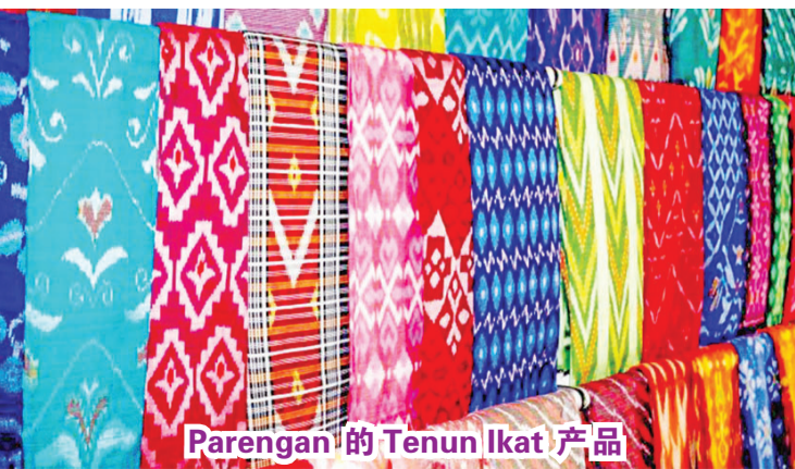
Parengan 的 Tenun Ikat 产品

【本报泗水讯】2022年3月5日,东爪哇省长科菲法(Khosrofah Indar Parawansa)对 Lamongan Parengan 村产品 ikat 和 Songket 手工织布印象深刻,将向印尼出口融资局(LPED)提议将该村作为外汇村。