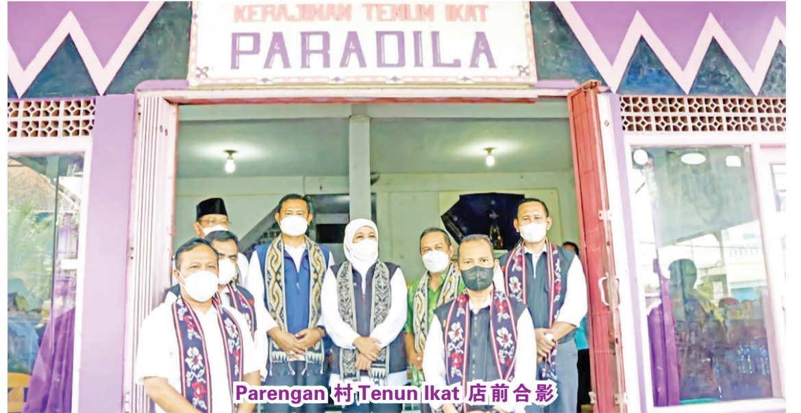
Parengan 村 Tenun Ikat 店前合影

店管理着 Parengan 村及其周边地区的居民,以维持 Lamongan ikat 编织的可持续性。在该村,有52个 ikat 编织业务单位,总数为2,700工人。至于每月的生产能力,达到了3,000件梭织