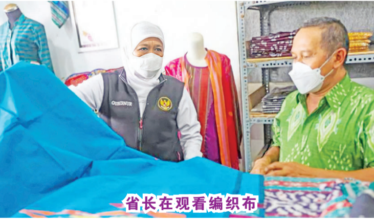
省长在观看编织布