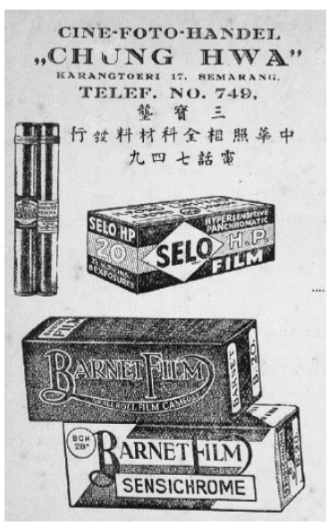
三宝垄一家华人照相器材商店的广告宣传单