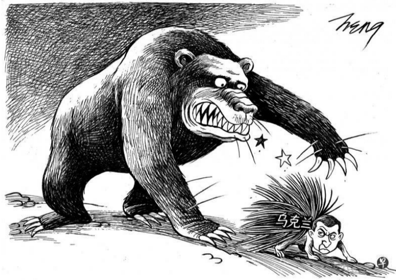
漫画 王锦松(原载《联合早报》)

苦难的血泪流成母亲河 我的母亲啊——印度尼西亚 大禹治水盼何时? 泪水流尽有期无?!