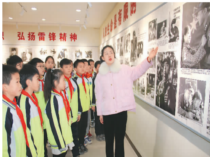
日前,河南省平顶山市卫东区关心下一代工作委员会与雷锋小学开展“学雷锋、树新风、做好事、争做好少年”主题活动。图为该校雷锋小学老师为孩子们讲解雷锋故事。

新华社北京3月3日电 近日,中宣部命名第七批全国学雷锋活动示范点和岗位学雷锋标兵,强调要以习近平新时代中国特色社会主义思想为指导,深入学习贯彻党的十九大和十九届历次全会精神,认真学习贯彻习近平总书记关于弘扬雷锋精神的重要指示,弘扬伟大建党精神,推动岗位学雷锋活动常态化,让雷锋精神在新时代绽放新的光芒。 此次命名的第七批全国学雷锋活动示范点和岗位学雷锋标兵各50个,都是来自企业、农村、机关、学校、社区、医院等基层一线的单位和个人,覆盖了各行各业、各个领域、各条战线。他们爱岗敬业、积极进取,自觉践行雷锋精神,在平凡的工作岗位上作出了不平凡的业绩和贡献,以实际行动书写了新时代的雷锋故事,是社会主义核心价值观的生动践行者,在弘扬新风正气、推动新时代公民道德建设方面发挥了良好的示范带动作用。 中宣部要求,各地区各部门要深入学习贯彻习近平新时代中国特色社会主义思想,深刻认识“两个确立”的决定性意义,增强“四个意识”,坚定“四个自信”,做到“两个维护”,以命名第七批全国学雷锋活动示范点和岗位学雷锋标兵为契机,坚持守正创新,加强组织领导,扎实深入开展学雷锋活动,不断提升公民道德素质和社会文明程度,汇聚起奋斗“十四五”、奋进新征程的强大精神力量,以实际行动迎接党的二十大胜利召开!