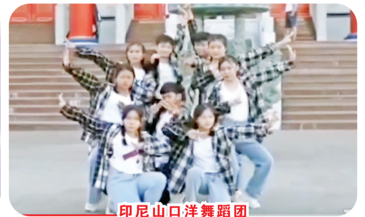
印尼山口洋舞蹈团