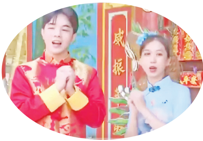
越南学生向各位拜年