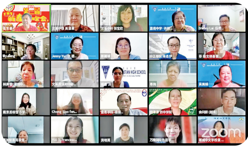
参与线上庆新春的各国代表