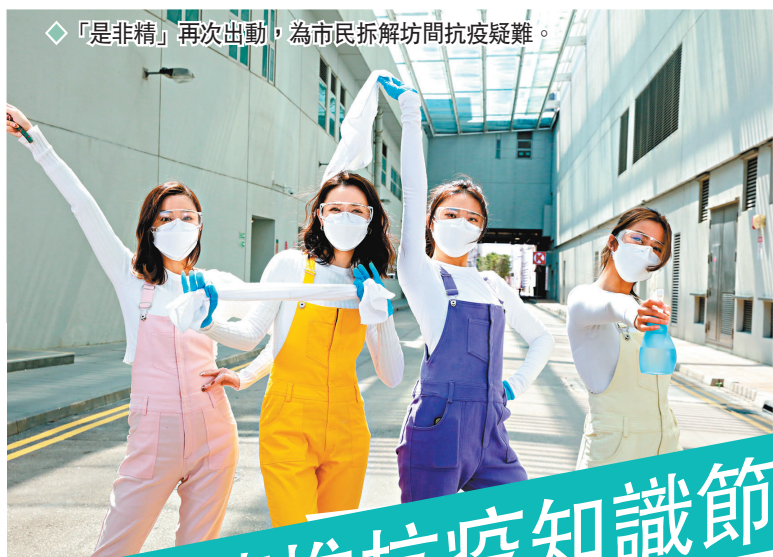
◆「是非精」再次出動，為市民拆解坊間抗疫疑難。

香港文匯報訊（記者 李思穎、凡文、達里）香港第五波疫情確診個案再幾何級數跳升，近年身在內地的成龍也時刻關注香港情況，除參與獻唱抗疫歌曲《獅子山下同心抗疫》，向全港醫護人員致敬外，更在廈門親自搬運捐助香港的防疫物資，名副其實身體力行助港抗疫。而無綫繼推出《爭分奪秒同抗疫》後，2日晚起推出另一相關節目《學是疫學非》，提高觀眾的抗疫意識，並請來專家拆解各項抗疫疑難。