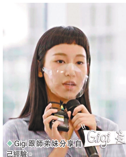
◆Gigi跟師弟妹分享自己經驗。