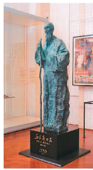
画家齐白石（雕塑）吴为山 维也纳世界博物馆藏

除了代表性的版画作品，美术日记也是此次展览的亮点之一。很长一段时间，美术日记都是李平凡创作的主要方式。他以线条和色彩替代文字，在纸上记录生活中的点点滴滴，为平凡生活赋予诗情画意。穿梭于这些尺幅不大的精美小品中，观众亦可以感受到生活的暖意和平凡而隽永的美。