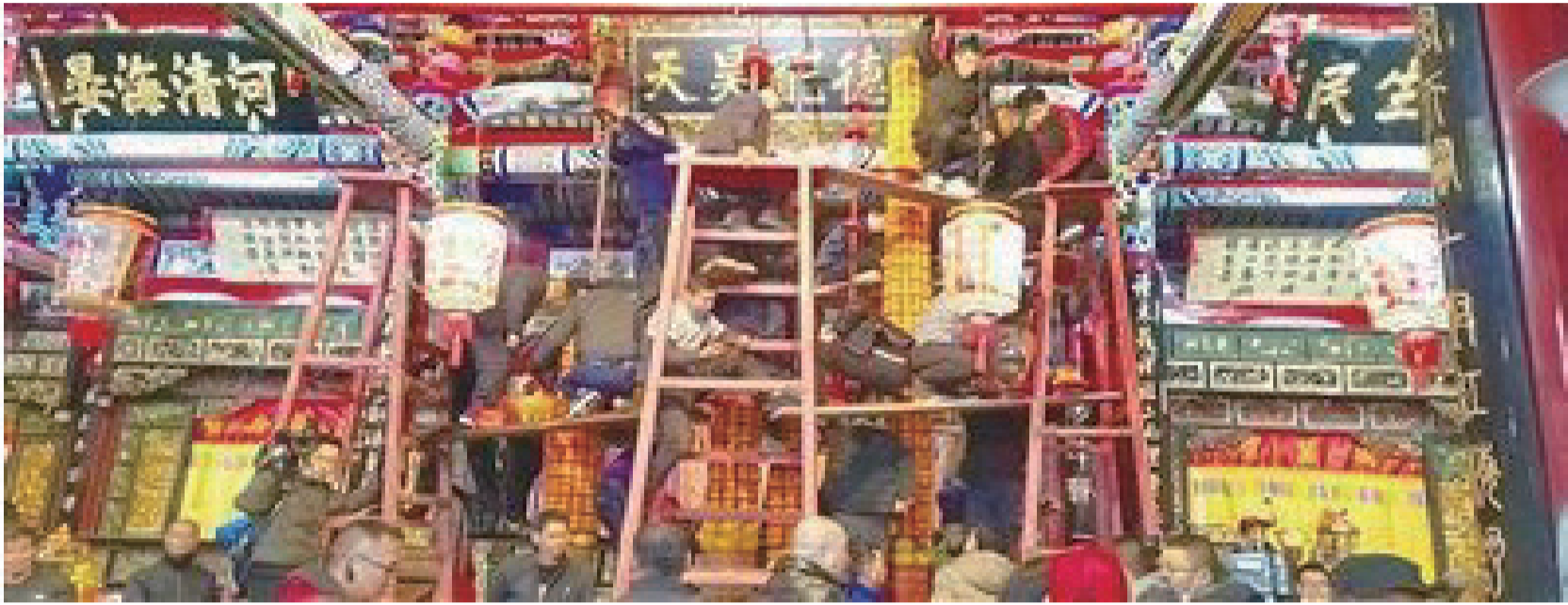
正月初三，福建省莆田市荔城區黃石鎮江東村壘桔塔迎慶元宵。

【莆田網訊】“江東桔塔天下無，莆田元宵第一鼓。”2月3日（正月初三），大戲開演、鑼鼓喧天，福建省莆田市荔城區黃石鎮江東村村民用精心挑選的大紅桔子，在浦口官前壘起15座紅桔塔（代表15個自然村），拉開了當地迎接元宵佳節的大幕。