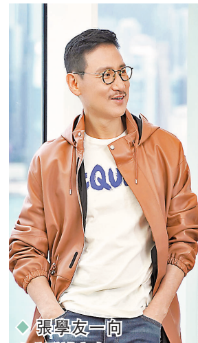
◆ 張學友一向十分愛護家人。