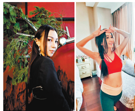
◆ AGA紅館開騷好事多磨。

她並謂每天都看電視留意香港疫情，亦有留意俄羅斯與烏克蘭戰爭，心情好難過，看到醫護界及救護員疲於奔命，在寒風冷雨中依然盡忠職守照顧香港市民，非常感動，Irene祝福香港疫情盡快過去，更祝福世界和平，不應該再有戰爭！