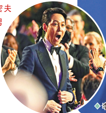
◆ 李政宰與鄭浩妍封帝稱后，成為一時佳話。