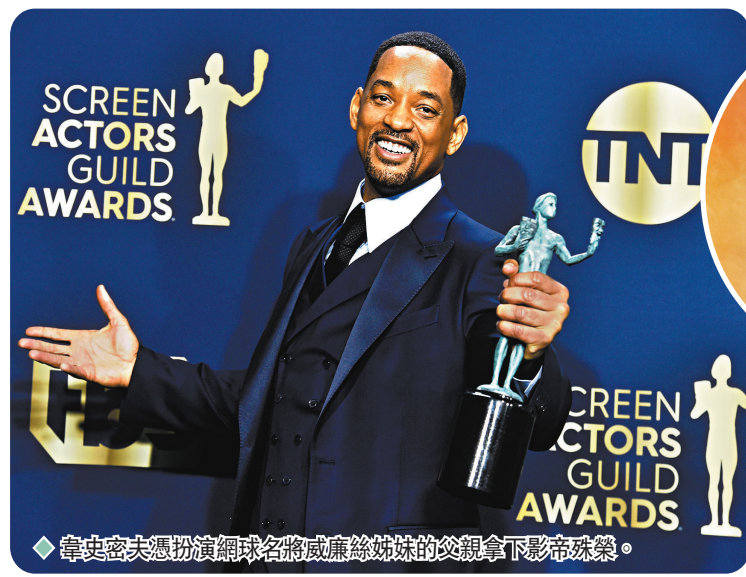
◆ 韋史密夫憑扮演網球名將威爾遜絲婷的父親拿下影帝殊榮。