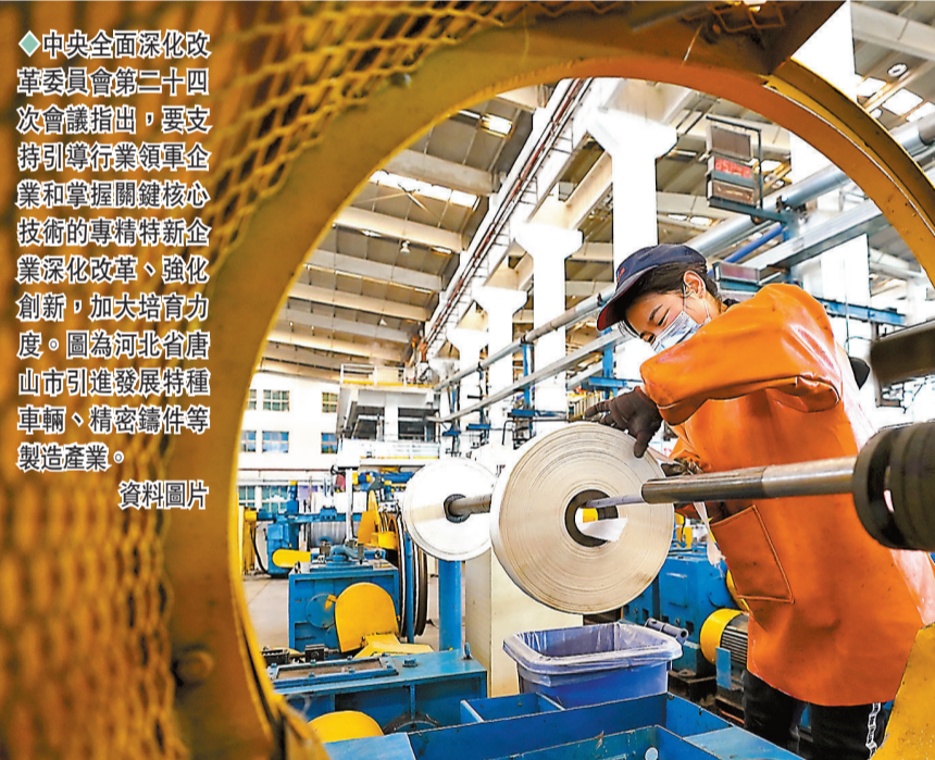
◆中央全面深化改革委員會第二十四次會議指出，要支持引導行業領軍企業和掌握關鍵核心技術的專精特新企業深化改革、強化創新，加大培育力度。圖為河北省唐山市引進發展特種車輛、精密鑄件等製造產業。

會議指出，我國擁有世界上規模最大的高等教育體系，有各項事業發展的廣闊舞台，完全能夠源源不斷培養造就大批優秀人才，完全能夠培養出大師。要走好基礎學科人才自主培養之路，堅持面向世界科技前沿、面向經濟主戰場、面向國家重大需求、面向人民生命健康，全面貫徹黨的教育方針，落實立德樹人根本任務，遵循教育規律，加快建設高質量基礎學科人才培養體系。要堅持正確政治方向，把