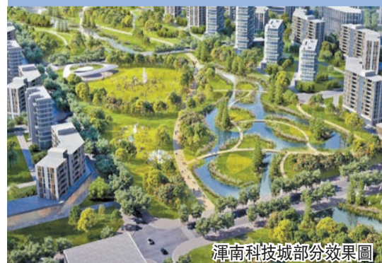
渾南科技城部分效果圖

目前，瀋陽渾南科技城以創新路為中軸，聚集了東北大學、材料科學國家研究中心、黎明航空發動機生產基地、中科院大學機械人學院、機械人與智能製造創新研究院等眾多科研院所和產業項目，已成為瀋陽最具影響力的「科創走廊」，多個創新能力強、特色鮮明的產業園區和產業集群發展迅速，臨空經濟區、國家自貿區、國家高新區政策疊加，科技人才、招商等政策優勢凸顯，發展環境得天獨厚。