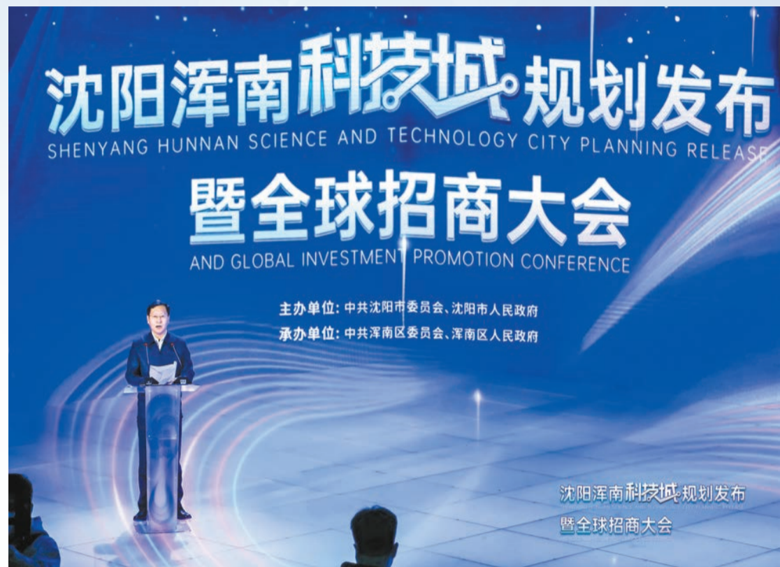
瀋陽渾南科技城規劃發布暨全球招商大會現場