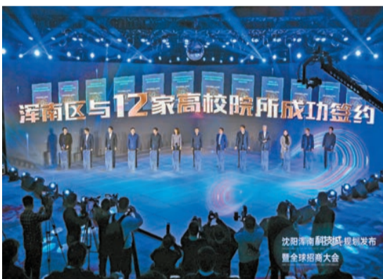
瀋陽渾南區與12家高校簽約儀式現場

招商政策上，瀋陽渾南科技城提出了與項目招引工作相對映的政策，在招引重大創新研發平台、重點創新服務平台、創新型企業及產業化項目、科技招商配套保障上四方面共12條的「真金白銀」的政策支持。其中提出，將全力支持重大科技基礎設施、新型研發機構、大企業創新中心落戶，配建最高10萬平方米辦公場地及人才公寓，對大企業研發中心按比例給予3年累計不超過5000萬元支持。對中試基地給予最高1000萬元建設經費支持，對科技服務平台按比例給予連續3年累計最高1000萬元資金支持等。對重點項目最高給予連續3年區域經濟貢獻60%額度的獎勵，對區域總部給予最高3000萬元辦公用房購置補貼，對高校院所重點科技成果在渾南轉化的給予最高3000萬元無償資金支持等。