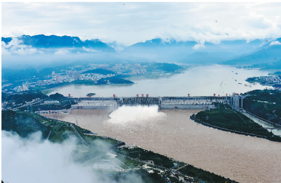
长江三峡水库泄洪腾库。