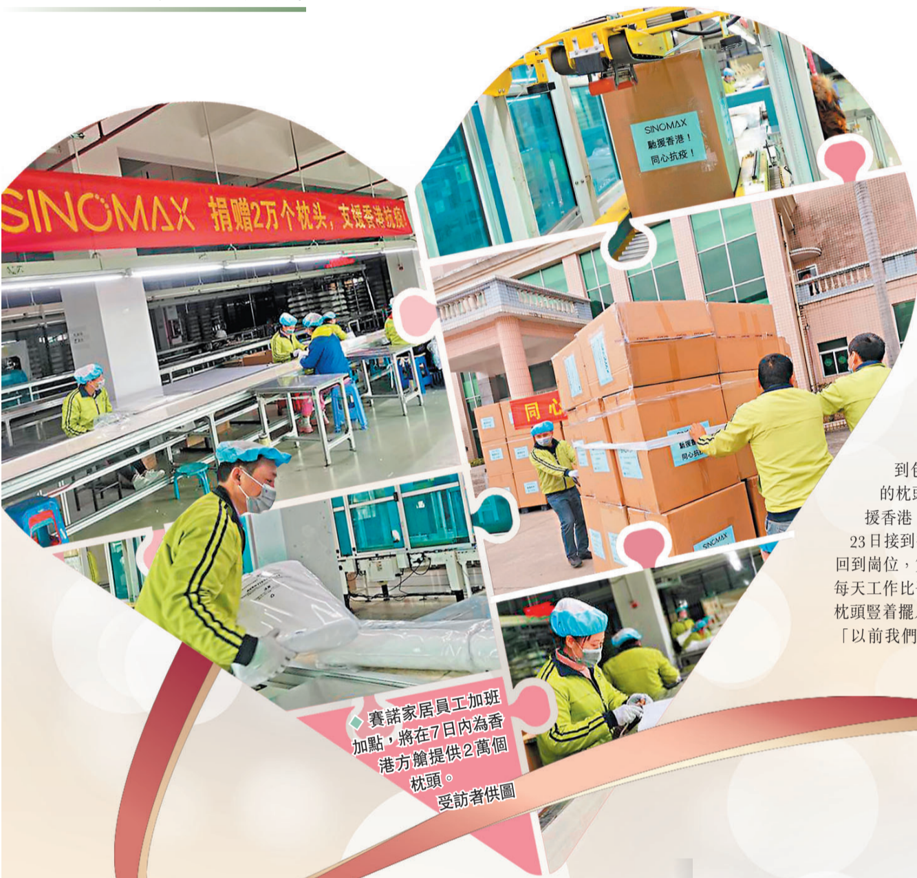
賽諾家居員工加班加點,將在7日內為香港方艙提供2萬個枕頭。

由於該企業正處於春節後復工初期,產品倉儲量不多,這便意味着所有支援抗疫的產品都需要現產。掛在生產車間的牆上「支援香港防疫!」的橫幅下,數十個工人緊張忙碌地接力完成生產枕頭的每一道工序。按照原本的產能,2萬個枕頭的生產周期需要20天。為了最大限度縮短工期,該企業開足馬力,增開多條生產線,部分生產線更從以往的一天12小時,增開至24小時。