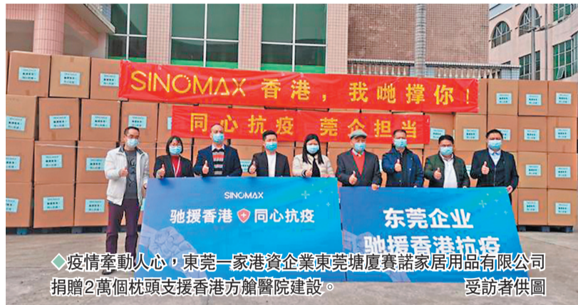
疫情牽動人心,東莞一家港資企業東莞賽諾家居用品有限公司捐贈2萬個枕頭支援香港方艙醫院建設。

香港文匯報訊(記者 盧靜怡 東莞報道)「香港,我哋撐你!加油!」疫情牽動人心,東莞港資企業東莞賽諾家居用品有限公司的廠房裏,十多名員工用粵語對着鏡頭為香港抗疫打氣。香港文匯報記者26日獲悉,該港企捐獻2萬個枕頭援助香港方艙醫院建設,物資價值近600萬元(人民幣,下同),首批6,000個枕頭已經在25日正式發出運往香港,餘下14,000個枕頭亦將於本周全部送達,後續還將繼續捐贈1,000張價值近200萬元的床墊。而為支援香港抗疫,該港企車間部分生產線已調整為24小時生產。