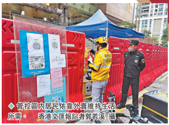
管控區內居民依靠外賣維持生活所需。

香港文匯報記者梳理發現,截至26日18時,深圳已通報確診病例軌跡涉及羅湖、福田、南山、寶安、龍華、龍崗、光明7個行政區,鹽田、大鵬、坪山3區無涉疫。全市已劃定逾20個封控區、管控區和防範區,被要求居家防疫的