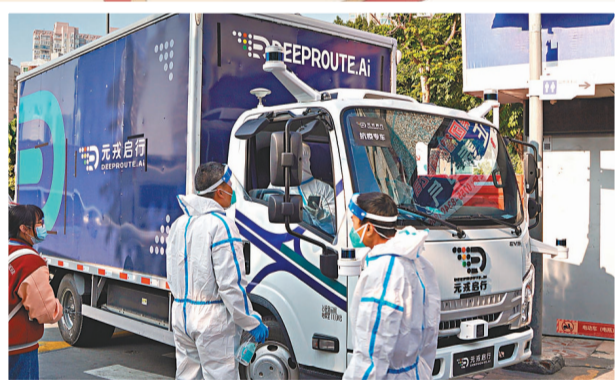
元戎啟行無人駕駛輕卡在運送抗疫物資。

在疫苗接種方面,截至2月25日,內地累計報告接種新冠疫苗31億1,462.2萬劑次,已有5億5,472.8萬人完成加強免疫。內地日前批准18歲以上的人群可進行序貫加強免疫,即接種兩針滅活疫苗後,可選擇接種腺病毒載體疫苗或重組蛋白疫苗作為加強針。中國疾控中心免疫規劃首席專家王華慶表示,依照規定,如果已完成加強免疫,就無需再進行序貫加強。