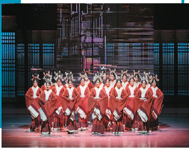
本文图片为舞剧《五星出东方》剧照

继续灵感来源于文物《千里江山图》的舞剧《只此青绿》走红后，舞剧《五星出东方》的出圈，再度让人们看到文物题材艺术创作的广阔空间。王一川认为，这部作品给艺术创作以宝贵启迪。中国还有许多像“五星出东方利中国”这样的文物在等待着各个门类的艺术家们，期待他们施展非凡想象力，让过去的那些精灵在当代生活中重新活起来，丰富观众对美好生活的享受和向往。