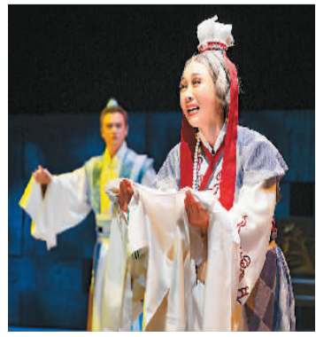
吕剧《归·源》剧照

这部剧一经亮相便收获许多肯定与好评。很多观众没想到吕剧还可以这样演，感觉耳目一新。大多数观众都是第一次走上大剧场的舞台看戏，获得了不一样的观剧体验，大家纷纷表示如此近距离观看演员的表演，十分震撼。