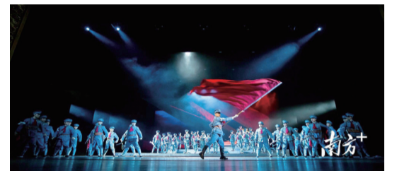
廣東首部大型原創民族歌劇《血色三河》，通過打造紅色文藝經典，讓紅色故事代代相傳。

總體工作思路，高標準高質量推進，不斷掀起黨史學習教育熱潮。 述往思來，向史而新。緊扣“紅色+”，大埔抓好一堂黨史課程、一場黨史宣講、一部黨史作品、一件民生實事，從開展黨史學習教育中不斷汲取智慧力量，在感悟真理中傳承蘇區精神，激發幹事創業熱情，推動各項工作邁上新臺階、取得新成效，凝聚起推動大埔老區蘇區全面振興發展的強大合力。