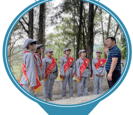
三河壩戰役紀念園與三河壩八一紅軍小學共同培育小講解員。