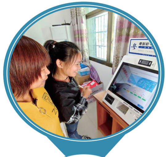
茶陽鎮戀墩村村民正在“粵智助”政府服務自助機前辦理業務。