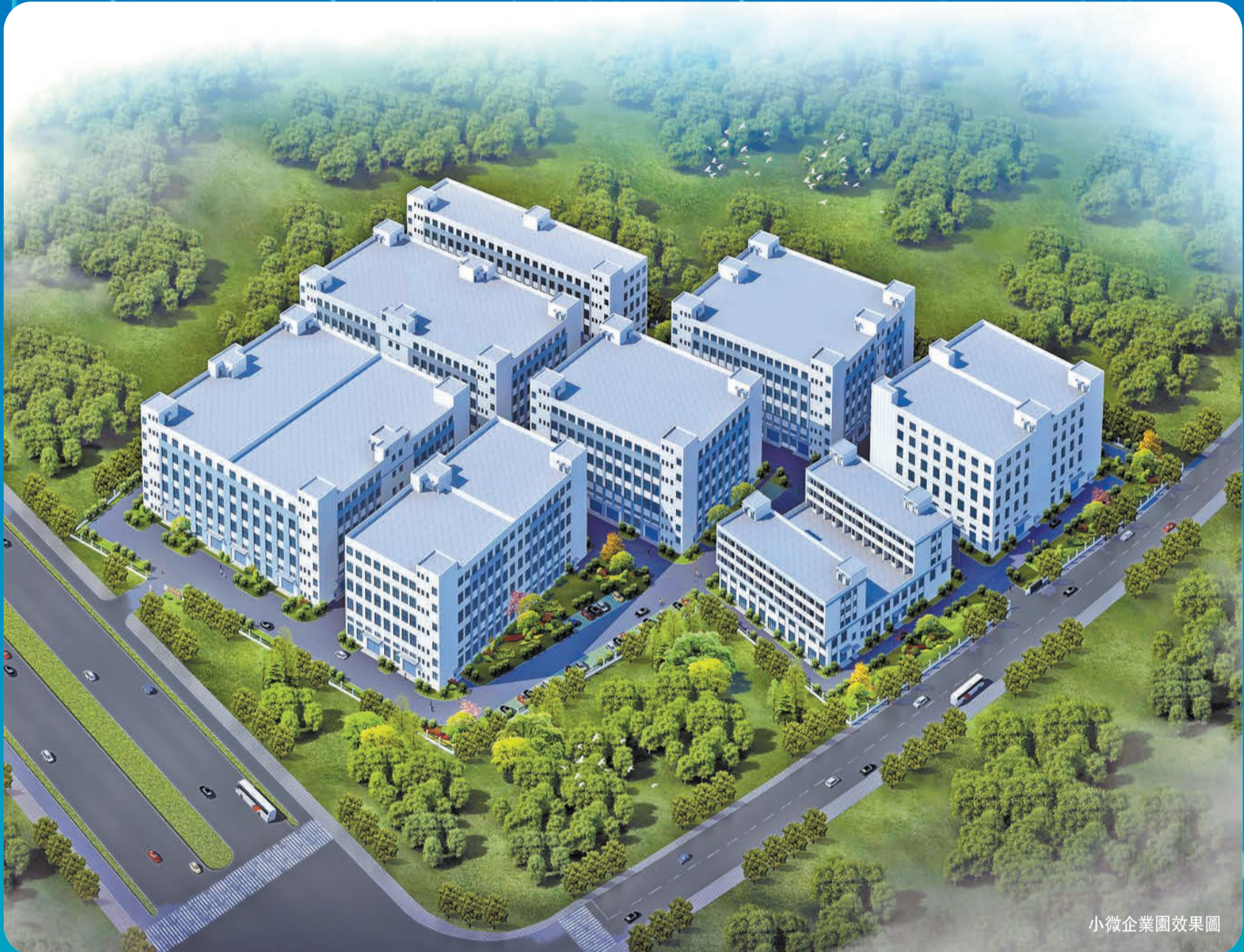
小微企業園效果圖

小微企業園聯建項目與相關的法律法規存在一定衝突，有違企業投資項目「一項一碼」「一碼一證」的原則，存在一定的法律風險。建議納入永康市改革創新容錯免責事項，消除審批部門和鎮（街道、區）相關責任人的後顧之憂，鼓勵幹部積極作為發揮重要作用，切實為入駐小微企業園項目解決實際困難。