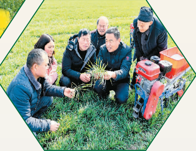
▲ 2月20日，在安徽省亳州市谯城区赵桥乡双楼村，科技特派员（右2）在田间为农民进行小麦春耕技术指导。